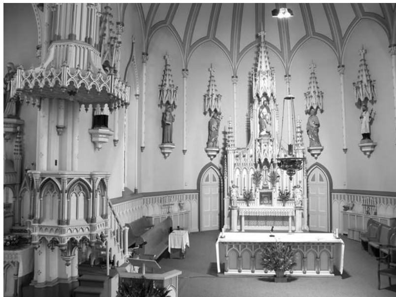
Chœur de l'église Saint-Joseph-de-Soulanges, Les Cèdres