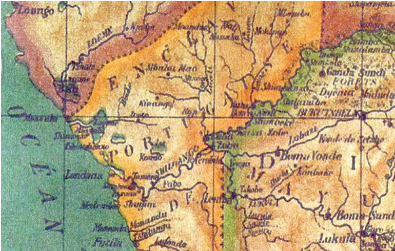
Carte du Bas-Congo, encadré de Carte du Congo belge (1913) 6 .