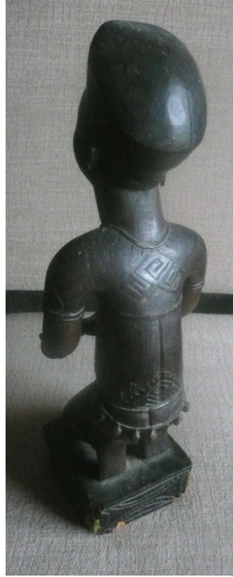
La poupée de Mambu, de face et de dos

C'est cet objet, de 312 mm de haut, dont il convient de reconnaître non seulement la qualité intrinsèque mais aussi l'exceptionnelle rareté parce qu'on connaît ses origines, le lieu où il a été produit, un terminus ad quem de 1906 à défaut d'une date précise, et jusqu'au nom et au portrait du sculpteur au travail. Cela n'a rien de surprenant dans le cas d'une œuvre européenne créée depuis la Renaissance, mais pour l'Afrique d'avant des années 1930, ce sont des informations rarissimes.