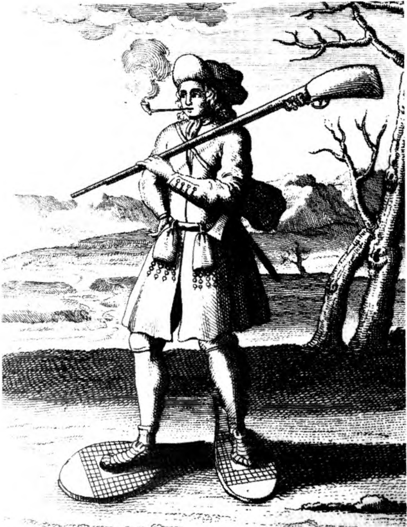
Figure 4: Cette gravure nous montre un milicien canadien en 1690. Le graveur a certainement travaillé d'après des renseignements précis mais qu'il n'a pas su rendre correctement. Notre milicien porte un capot serré à la taille par une ceinture. Les manches sont garnies de pattes de parement dont les boutons ont été placés du mauvais côté des boutonnières. Le graveur a également omis d'ajouter un capuchon à ce capot alors que la présence de cet élément est amplement attestée par les documents. (La Potherie, Histoire de l'Amérique Septentrionale , Paris, 1722, photo et collection fonds Melzack-Baby, Université de Montréal).