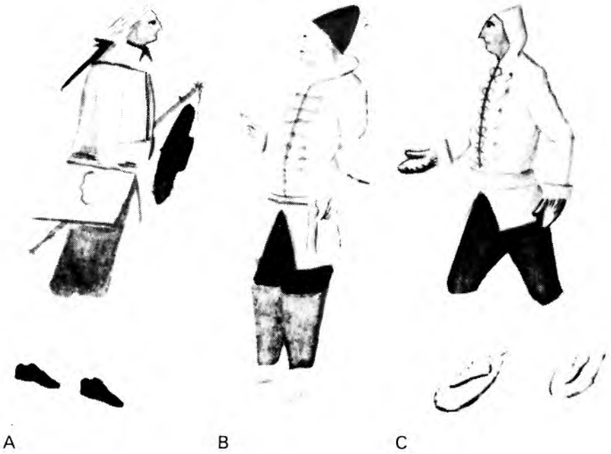
Figure 8: Ces trois canadiens ont été peints par un émigrant allemand dans les années 1775-1785. A) Cet habitant porte un capot blanc liséré de rouge, il est croisé uniquement par une ceinture. Sous le coude nous notons la présence d'une "patte de côté", simple fente qui permet d'avoir accès aux poches de la culotte ou du gilet quand le capot est fermé. B) Cet autre habitant porte un capot blanc égayé de rubans bleus. Son capot est fermé par une série de neuf brandebourgs. Nous remarquons également la présence de parements. C) Ce raquetteur porte lui aussi un capot blanc décoré de rouge. Il se croise au moyen de rubans dont la disposition complexe crée sur la poitrine un dessin hautement décoratif.