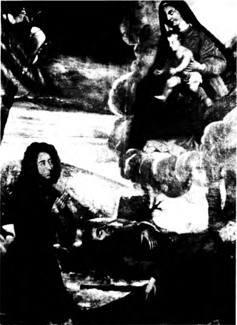
Figure 5A: L'ex-voto de Notre-Dame de Liesse constitue un témoignage capital pour l'étude du costume en Nouvelle-France; c'est en effet la meilleure représentation de personnages vêtus à la canadienne datant du régime français. Ce tableau ne porte ni date, ni signature. Toutefois à certains détails, nous pouvons avancer qu'il a été peint dans la première moitié du XVIII ème siècle. Signalons que ce tableau a un urgent besoin de restauration.