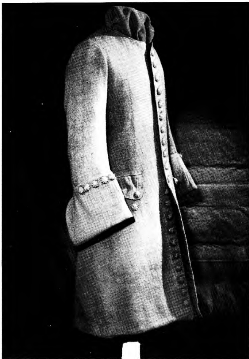
Figure 2: Justaucorps français, circa 1725. Appelé également "habit à la française", ce vêtement aux lignes élégantes servira de modèle aux "capots à la canadienne" afin de les rendre plus élégants que les grossiers "capots de mer".