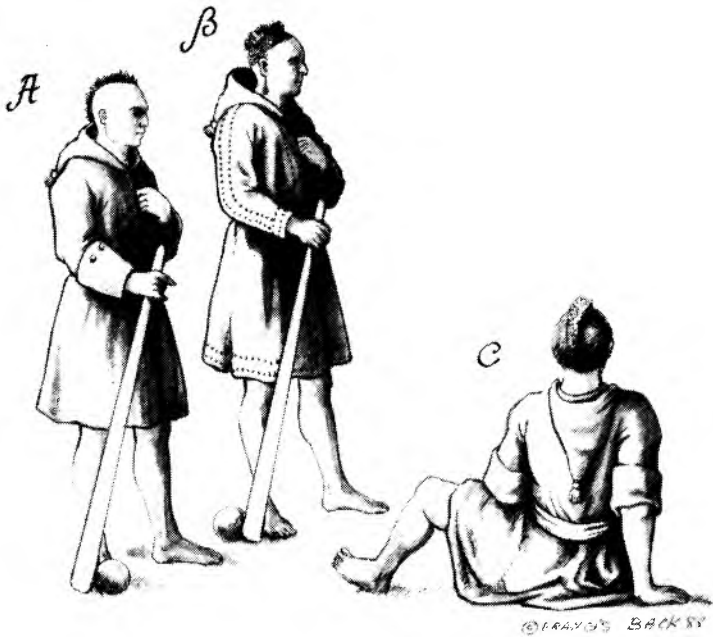
Figure 3: L'hydrographe et cartographe Jean-Baptiste Louis Franquelin résida à Québec de 1672 à 1691. Il nous a laissé sur ses cartes de très bonnes représentations d'Indiens, dont ces trois Hurons en capot. A) Dessiné en 1708, ce Huron porte un capot dont les parements sont en "botte" et sur lequel deux boutons sont visibles. B) Datant de la même année cet autre Indien porte un capot sans parement. L'ensemble de ce vêtement est décoré par des rangées de rassade. C) Cette vue de dos, dessinée en 1699, est particulièrement instructive car nous distinguons bien la ceinture et le capuchon dont l'extrémité se termine par un pompon, comme sur les deux figures précédentes. Les manches sont retroussées ce qui permet de déduire qu'elles ont des pattes de parement ou des parements à la matelote. (A: Division Cartes et Plans, Bibliothèque Nationale de Paris; B et C: Service Historique de la Marine, Vincennes, Fac-simile Francis Back).