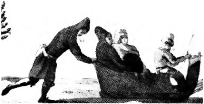
Figure 7: Les deux personnages de gauche vêtus de capots de castor ont été peints par Peachey en 1781. Apparue au XVIII ème siècle, les capots de castor furent d'un usage restreint, étant particulièrement utilisés par l'élite pour les randonnées en carriole.

de la haute bourgeoisie de Québec, l'ingénieur Louis Franquet note dans son journal: "Quand les Canadiens voyagent l'hiver ils se précautionnent beaucoup contre le froid"; et "se couvrent le corps d'un capot de castor le poil en dehors". 79 Ce passage semble suggérer que le capot de castor est porté par l'ensemble de la population canadienne, toutefois les archives notariales nous démontrent que c'est loin d'être le cas. Les quelques mentions que nous avons relevées, l'ont été dans des inventaires d'individus bien nantis tel le Baron de Longueuil, qui possédait en 1755 un "capot de castor avec son capuchon". 80 Fait intéressant à noter, une des seules représentations que nous ayons de capot de castor au XVIII ème siècle nous montre trois personnages en train de s'amuser en carriole près des chutes Montmorency, un contexte très proche de celui dans lequel Louis Franquet écrit l'extrait cité plus haut (Figure 7).