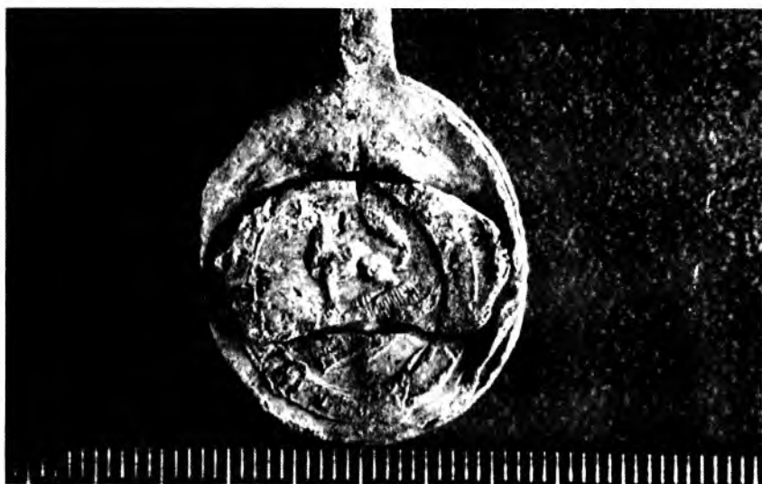
Sceau d'emballage de la Compagnie de la Baie d'Hudson provenant du site DaGt-1, situé sur les rives du lac Opasatica (Marc Côté, Corporation Archéo-08, 1988). Photo reproduite avec la permission de l'auteur.