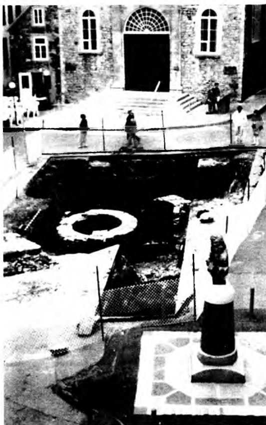
Secteur de fouille des habitations de Champlain, Place Royale, Québec (Cérane, 88.D.25.289).