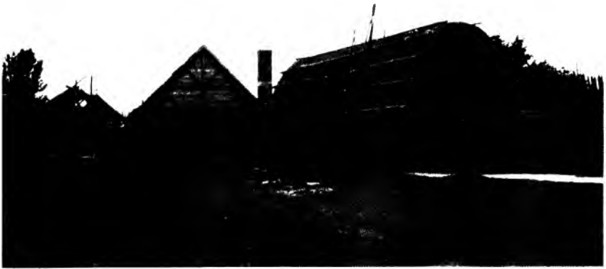
Reconstitution d'un édifice européen et d'une « maison longue » amérindienne à Sainte-Marie-aux-Hurons (G. Piédalue, Parcs Canada, septembre 1981).