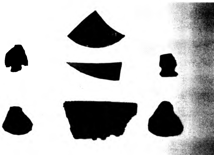
Tesson de céramique et pointes de flèches amérindiens, ainsi que des grattoirs fabriqués à partir de tessons de verre à vitre et de pierres à fusil européens, retrouvés sur le site du poste de traite de Jolliet (G. Piédaluc, Parcs Canada, décembre 1991).