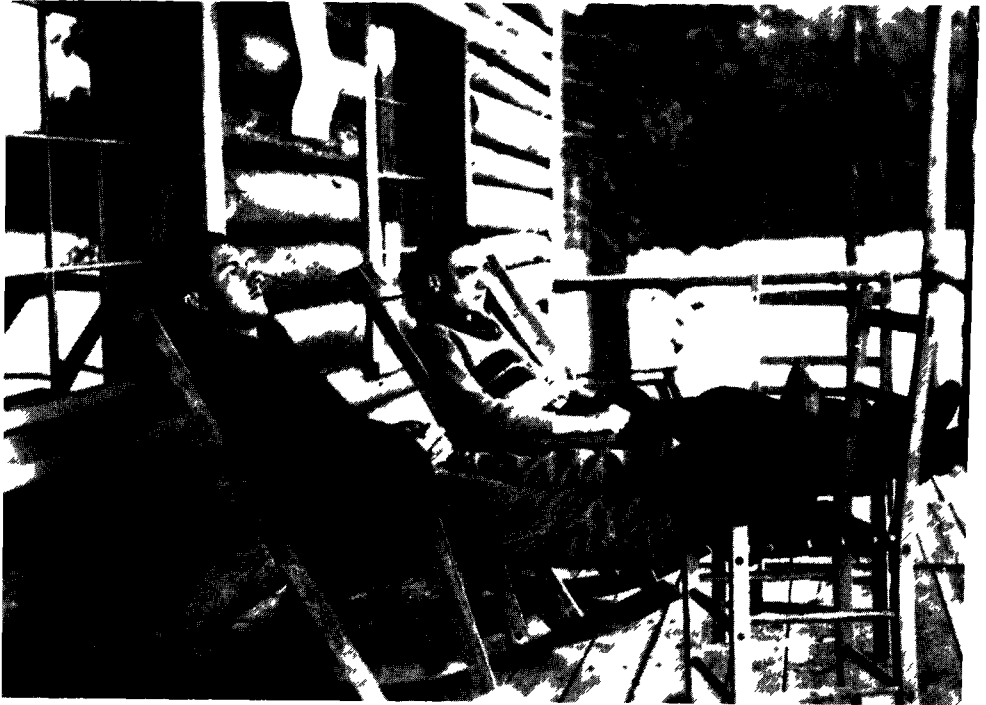
Saint Denis Garneau et André Laurendeau, à la maison de campagne des Laurendeau, à Saint-Gabriel-de-Brandon, mai 1932