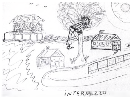
Un patient psychotique d'une trentaine d'années se décrit, agrippé à sa peur, à la suite de l'interruption d'un groupe d'expression graphique auquel il était très attaché.

Le chemin le moins facile, le «moins fréquenté» souligne pertinemment Scott Peck 10 , c'est celui qui part de soi, de l'expérience personnelle, et qui y retourne ultimement.