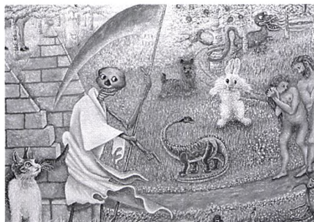
Adam et Ève chassés du Paradis Terrestre