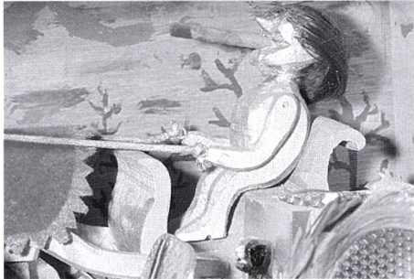
La charrette de la mort