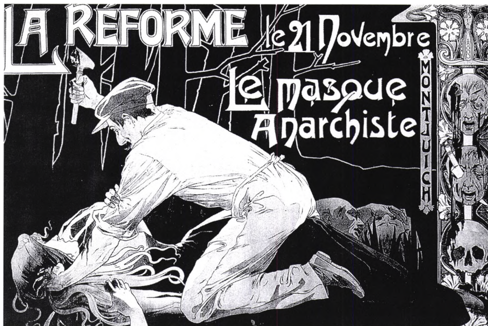
Privat-Livemont, affiche réactionnaire Belge, 1897

Comme nous vivons en aval de la Déclaration universelle des droits, il nous est facile de nous illusionner sur la solidarité apparente de nos droits et sur la vigilance protectrice de nos devoirs. Des drames comme la guerre des Balkans nous rappellent combien ce leurre nous est facile, surtout quand il nous tend le piège de l'oubli. S'il n'y a pas de droits sans peur surmontée, il n'y a pas de survie pour nos droits sans la peur remémorée, sans un outrage qui nous fouette à l'exercice de nos devoirs. On croirait que toute la panoplie des menaces réelles dont nous sommes la cible devrait suffire pour nous garder en alerte. Mais, de la guerre du Vietnam jusqu'au massacre du Rwanda, nous avons l'outrage de courte haleine; si la réalité ne nous ennue pas, elle nous désamorce. C'est pourquoi le cœur de nos sociétés de droits bat dans l'imaginaire, plus précisément dans la peur imaginée, qui nous transporte vers des temps et des espaces qui sont en dehors