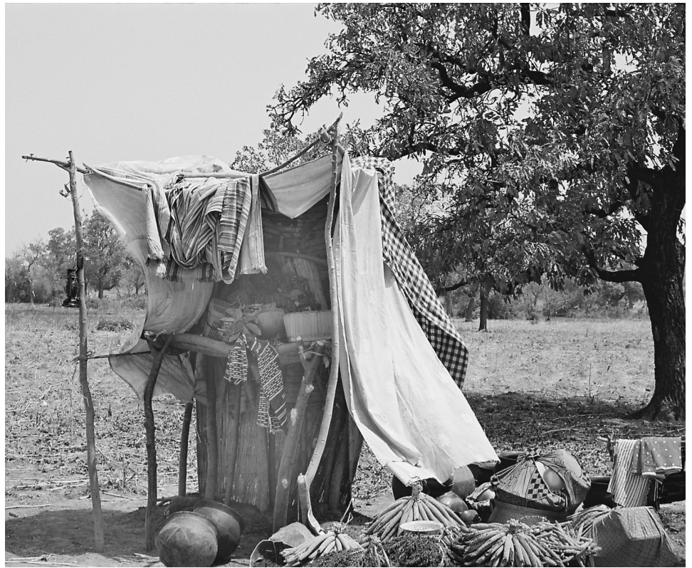
Le catafalque entouré des symboles de la réussite du défunt.

Le défunt apprêté est alors installé par les fossoyeurs dans un siège adossé à un mur près de l'entrée principale, à l'extérieur de sa maison qui est un espace public. Sous ce siège, une natte en épis de mil permet que les pieds du défunt ne touchent pas le sol, ce qui serait un manque de respect. En effet, il fut un temps où l'absence de natte désignait l'esclave ou l'inconnu. D'autre part, le corps ne doit pas toucher la terre qui lui a donné la vie et qui ne la reprendra qu'au moment de l'inhumation. Le défunt est installé avec les attributs de son sexe, symboles de sa réalisation en tant qu'homme ou femme. Les hommes portent un arc sur les genoux et, en bandoulière, un carquois contenant quelques pailles servant à fabriquer les flèches mais sans pointe et trois vraies flèches (3, chiffre lié à l'homme) dont il pourra faire usage s'il croise le fantôme de l'un de ses ennemis lors de son voyage vers le