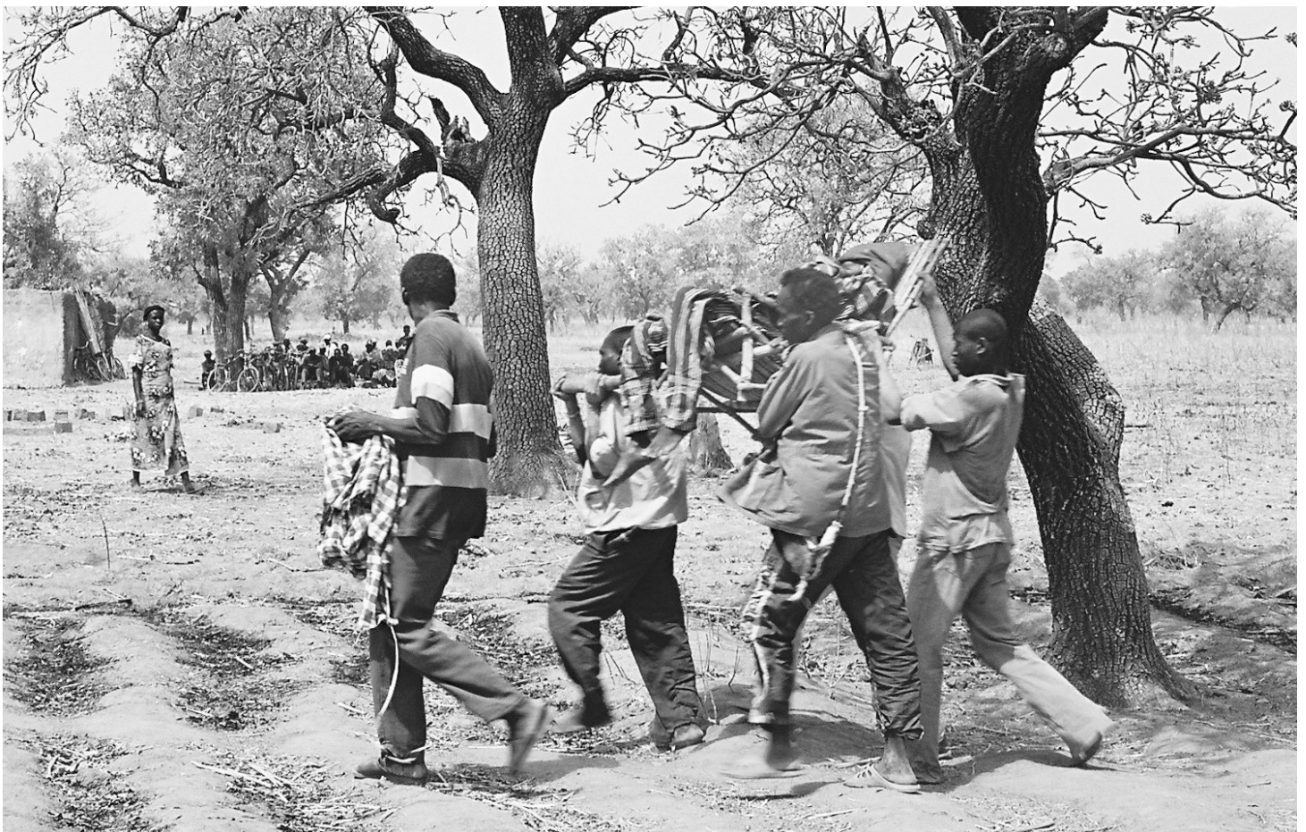
Les fossoyeurs transportant le défunt pour l'inhumation.

cylindrique gàngàar , semble bien être signalétique : à son audition, on sait qu'un décès vient de survenir, où il a eu lieu et quel est le sexe de la personne décédée. D'autre part, cet ensemble est joué pendant la phase liminaire de la cérémonie qui va de l'annonce du décès au véritable déclenchement de la cérémonie quand, le défunt étant sur le catafalque, les cantateurs commencent le làngnìn accompagné par l'ensemble dègàar . Elle est à la fois un moment de préparation (préparation du défunt pour la cérémonie et préparation de la cérémonie elle-même : annonce de la nouvelle, construction du catafalque, etc.) et un moment d'attente, principalement de l'arrivée de l'assistance sur le lieu de la cérémonie. La nuit, durant laquelle sont également joués les xylophones lóbrí , ressemble également à une phase d'attente : le défunt, s'il reste le point focal, ne préside plus comme du haut du catafalque, il n'y a plus de cantateur et dans l'ensemble, l'intensité est réduite, beaucoup de gens finissant par aller dormir. De même, les moments où le défunt est sur le catafalque, où il n'y a pas de cantateurs disponibles et où l'on repasse du dègàar aux lóbrí semble bien être également un moment d'attente : attente que des cantateurs viennent « chanter » leurs louanges et lamentations.