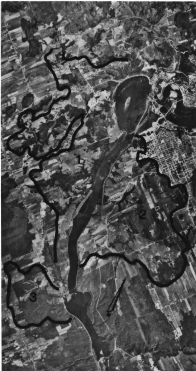
FIGURE 2. La région de Shawinigan. Amphithéâtres: 1) Saint-Boniface; 2) La Bissonnière; 3) Saint-Étienne-des-Grès.

The Shawinigan area. Amphitheatres: 1) Saint-Boniface; 2) La Bissonnière; 3) Saint-Étienne-des-Grès.