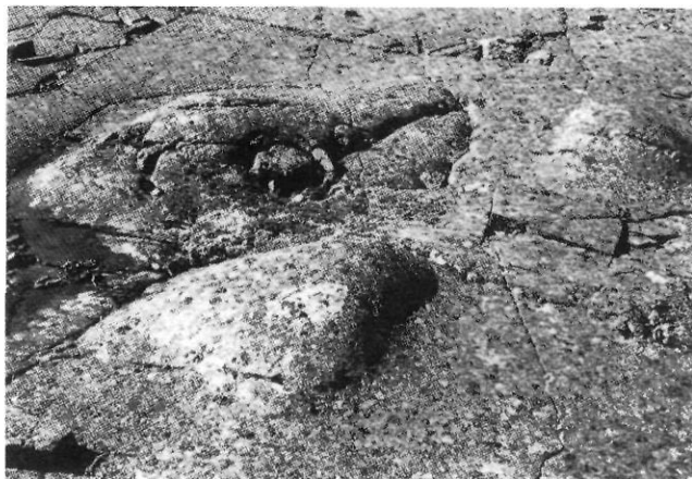
FIGURE 4. Nouures obtenues de noyaux résistants sertis dans le basalte (écoulement des glaces vers la droite, en haut) de la Grande Île, Hudsonie, Québec.

Knots carved on hard core in basaltic rock (glacier flow towards the upper right), Hudson Bay, Québec.