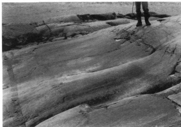
FIGURE 2. Ensellure sur dyke de diabase disposé transversalement à l'écoulement des glaces (vers la droite), le long de la Grande Rivière, Jamésie, Québec.

Des éléments nodulaires de la roche du lit glaciaire, ou des inclusions de tous genres plus résistants que la masse enrobante, peuvent être dégagés par abrasion glaciaire différentielle (fig. 4) ; ils s'offrent alors sous forme de nœuds surbaissés d'aspect arrondi, à base circulaire ou ovale ; dans un tracé en plan, ces renflements sont d'échelle millimétrique