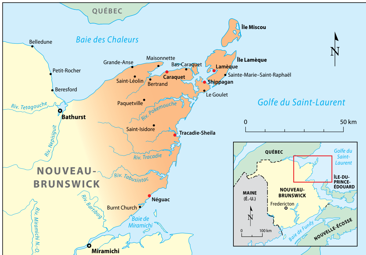
Carte 1 Territoire de la Péninsule acadienne