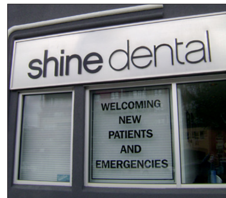
Photo 7 Enseigne unilingue anglaise

un certain nombre de touristes, aimeraient voir un message en anglais.