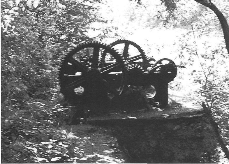
Friche du premier moulin