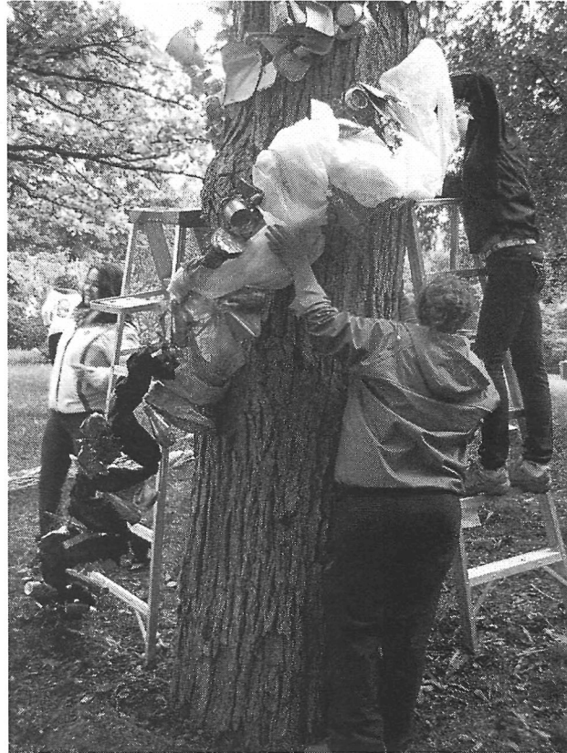
Des élèves durant l'installation in situ pour la création Arbre métissé