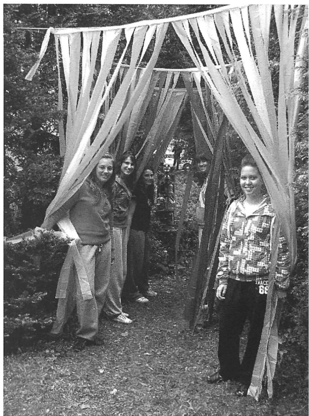
Les jeunes créateurs devant leur œuvre À travers l'inconnu...