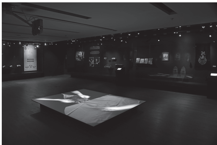
Fig.4 Nadia Myre, vue de l'exposition Decolonial Gestures or Doing it Wrong? Refaire le chemin , 2016.