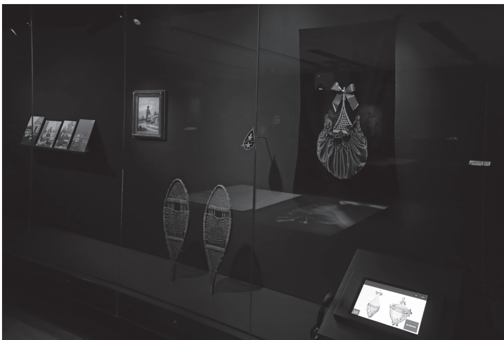
Fig.3 Nadia Myre, vue de l'exposition Decolonial Gestures or Doing it Wrong? Refaire le chemin , 2016.