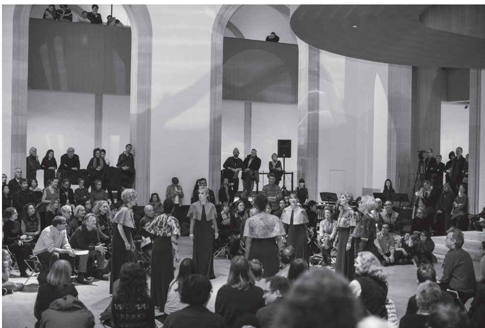
Fig. 9 Sara Angelucci, A Mourning Chorus , 2014