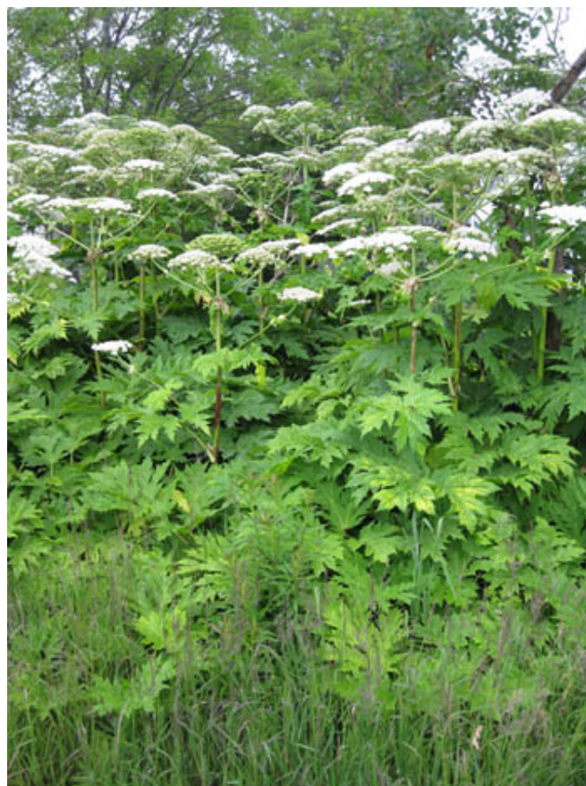
Isabelle Simard, MDDELCC

Source : http://plantesenvahissantes.org