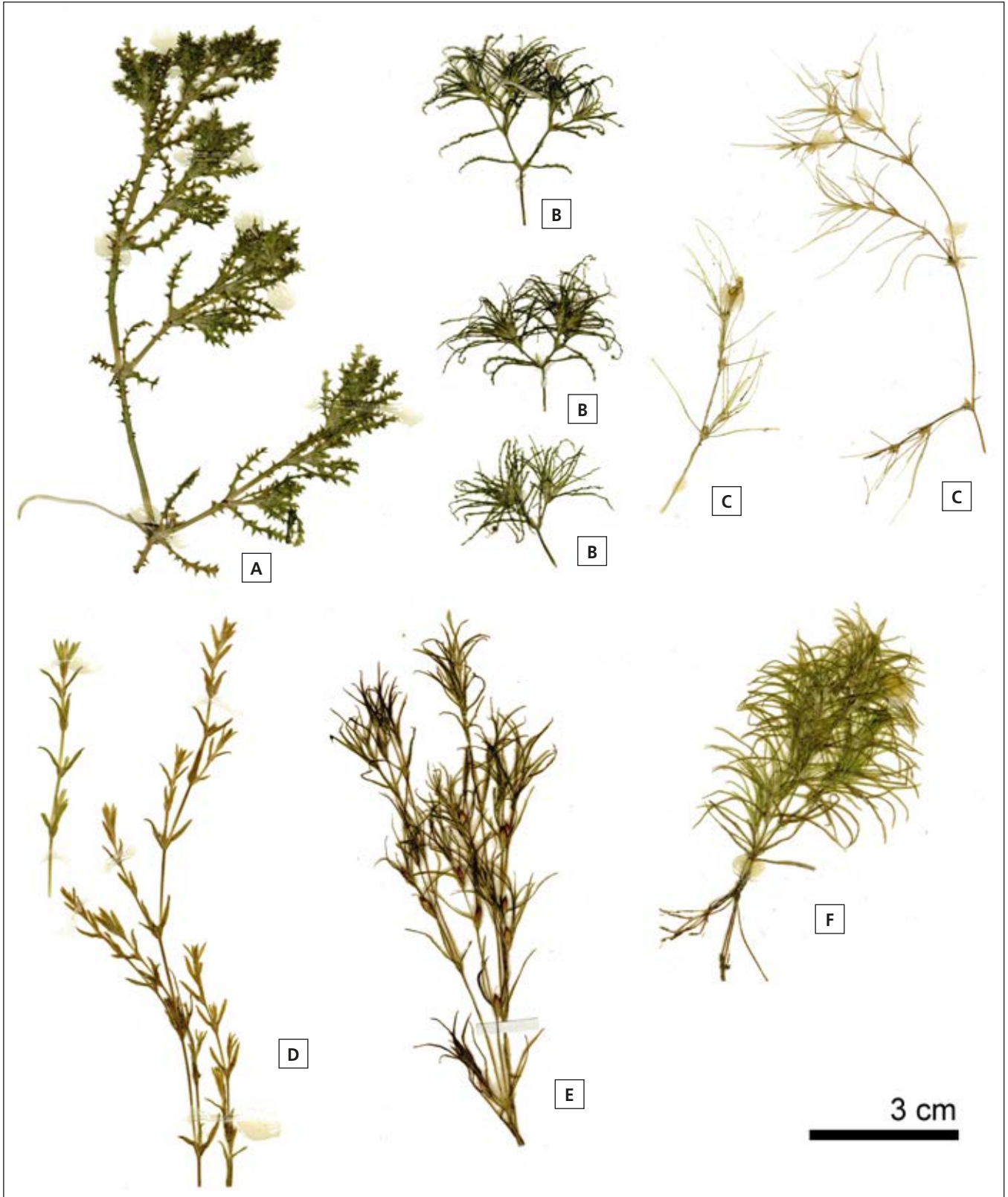
Figure 1. Port des espèces de naïades du Québec: Najas marina (A), N. minor (B), N. gracillima (C), N. guadalupensis subsp. olivacea (D), forme allongée du N. flexilis s.l. (E), forme buissonnante du N. flexilis s.l. (F). Les spécimens sont tous représentés à la même échelle (3 cm). Crédit photo : Étienne Léveillé-Bourret, spécimens de l'Herbier national du Canada, numéros d'accession CAN 333679, CAN 320708, CAN 448664, CAN 347274, CAN 115507 et CAN 398435.