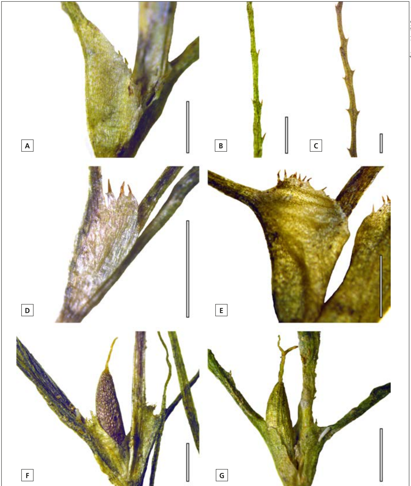
Figure 2. Caractéristiques morphologiques importantes de Najas flexilis , N. gracillima et N. minor . Gaine de la feuille de Najas flexilis (A), N. gracillima (D) et N. minor (E), forme et dentition du limbe des N. gracillima (B) et N. minor (C), et forme du fruit des N. gracillima (F) et N. minor (G). Échelle = 1 mm pour toutes les photos.