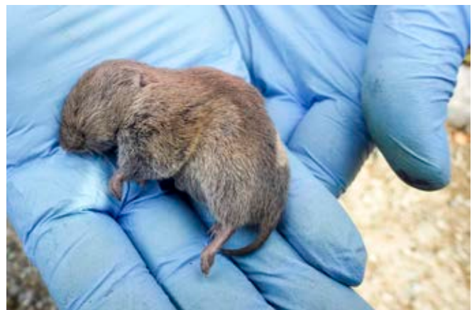
Patricia Brouillette, 2013

Ce Microtus est monogame, et le mâle participe à l'élevage des jeunes. La reproduction s'échelonne sur une longue période. Au Québec et en Ontario, on présume qu'elle s'étend de mai à octobre, durant les mois les plus chauds (COSEPAC, 2010). La femelle produit de 1 à 4 portées par