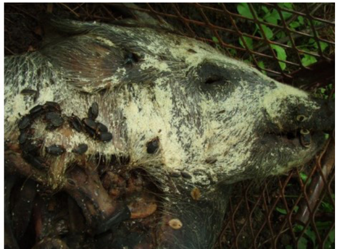
Figure 5. Au jour 209 (28 mai 2013), les adultes du silphe marginé Oiceoptoma noveboracense (Foster) s'alimentent et s'accouplent sur la carcasse. La tête du porcelet est couverte d'une deuxième vague d'asticots.