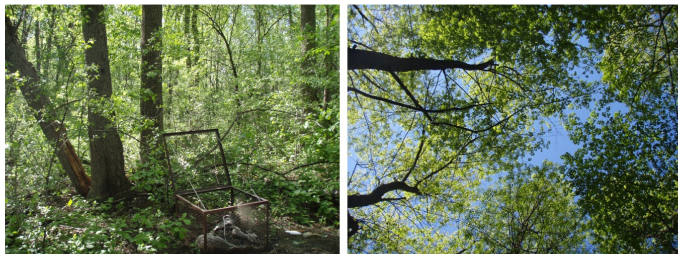
Figure 2. Photos de la cage de fer, du milieu environnant et de l'ouverture de la canopée.