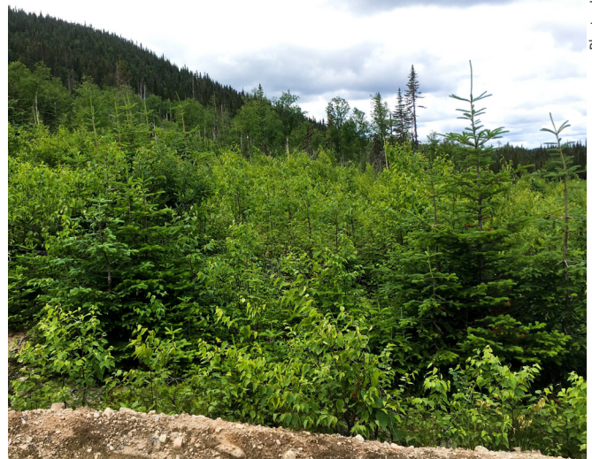
Figure 3. Lieu de récolte du second spécimen de Zicrona caerulea (9 juillet 2019), dans le parc national de la Jacques-Cartier, Québec, Canada.

L'auteur a obtenu les dates et lieux de capture par l'entremise du Guide d'identification des punaises à bouclier