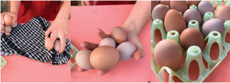
juin 2020

de 1908, le manque de précision des recensements ne permet pas d'évaluer le nombre d'animaux de basse-cour par ferme ni de savoir s'il s'agissait de volailles pour la chair (poulet de chair) ou pour les œufs (poules pondeuses). Il est seulement mentionné dès 1908 que « la vente des œufs et leur production donne lieu à un commerce considérable ». Entre 1929 et 1952, le nombre de volailles est passé d'environ 900 000 « poules » à 1 400 000, sans plus de précision pour savoir s'il s'agit d'animaux pour la chair ou pour la ponte.