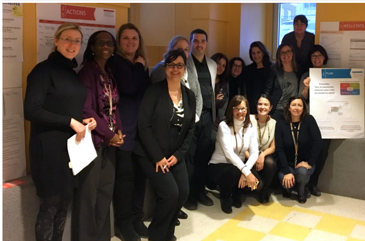
Figure 4. La salle de pilotage tactique de la DSM

de l'organisation et chaque secteur et service peut y contribuer. Il fait également le lien avec le Vrai Nord puisque le nombre de stages est également suivi en salle de pilotage stratégique. Les projets organisationnels auxquels contribue la DSM sont aussi discutés pour faire le point et permettre d'escalader les enjeux en salle de pilotage stratégique. D'une animation de salle à une autre, les gestionnaires sont en mesure de constater la progression et l'avancement des projets. Ces échanges rapprochent les gestionnaires et favorisent le partage et l'entraide. L'animation des salles est faite à tour de rôle par les gestionnaires. La directrice et la directrice adjointe jouent un rôle de coach avant chaque rencontre auprès du gestionnaire qui animera cette dernière, favorisant ainsi l'engagement et l'apprentissage d'un nouveau fonctionnement. L'animation permet également aux gestionnaires d'établir des liens et de voir une cohérence entre les actions de l'organisation. L'animation de la salle de pilotage tactique DSM a lieu aux deux semaines. Tous les gestionnaires de la direction adjointe réadaptation, qualité et développement de la pratique professionnelle y