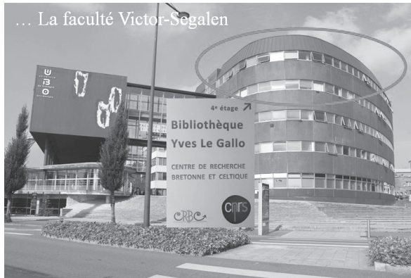
Centre de recherche bretonne et celtique. Faculté Victor-Segalen Université de Bretagne occidentale, Brest

maquereau de dérive). 3 » On retrouve là, sous la terminologie hésitante d'un non-initié, l'ambition qui guide Jean-Michel Guilcher : il s'agit de collecter de toute urgence ce qui relève encore de la « civilisation traditionnelle » en Bretagne, ceci en s'en enquérant auprès des derniers dépositaires d'une certaine manière d'être au monde, qui n'a plus cours depuis 1914 mais qui survit dans les mémoires de ceux ayant connu cette époque.