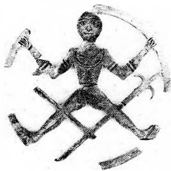
Anonyme, Anneau ou pendant d'oreilles , Fredrickson et Gibb, pl. 149.

Le catalogue de S. Gibb suit l'essai. Il a été divisé en douze sections ; chacune porte un titre et est précédée d'un paragraphe introductif. Pour toutes les pièces les