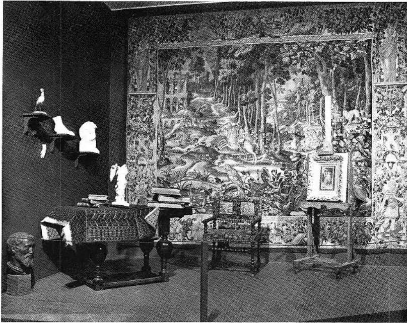
FIGURE 1. Reconstitution de l'atelier de Bouguereau au Musée des beaux-arts de Montréal, 1984.

Zénobie retrouvée par des bergers sur les bords de l'Araxe 1 révèle chez Bouguereau, étudiant de l'École des beaux-arts, une grande maîtrise du dessin, une composition en hauteur savante et originale et surtout, ce parti pris de distribuer les valeurs arbitrairement en fonction d'une efficacité plastique et qui conférait déjà son caractère abstrait à l'Égalité de 1848.