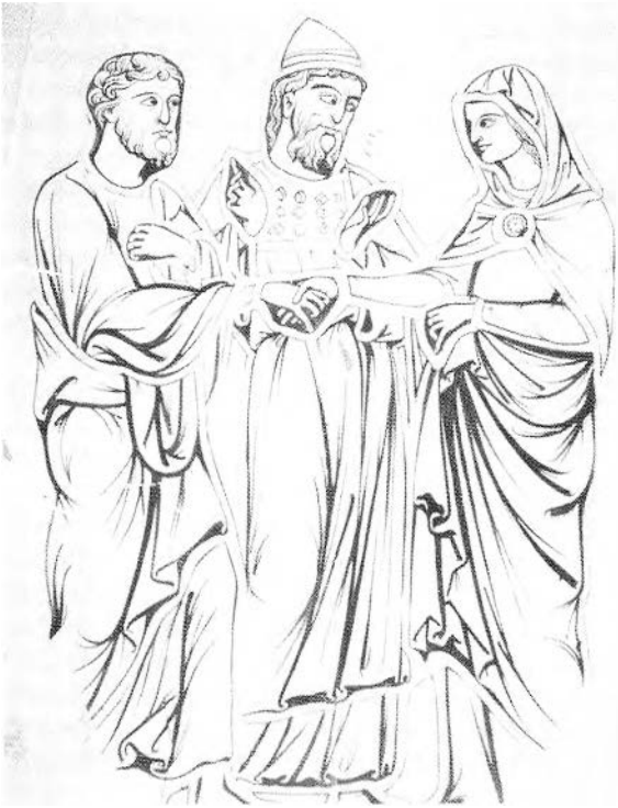
FIGURE 82. Lyon, Institution des Chartreux, maquette en grandeur d'exécution, Mariage de la Vierge, dessin Louis Steinheil.