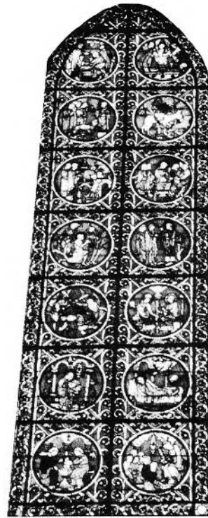
FIGURE 83. Paris, cathedrale Notre-Dame, verrière de sainte Geneviève, Louis Steinheil, 1860.