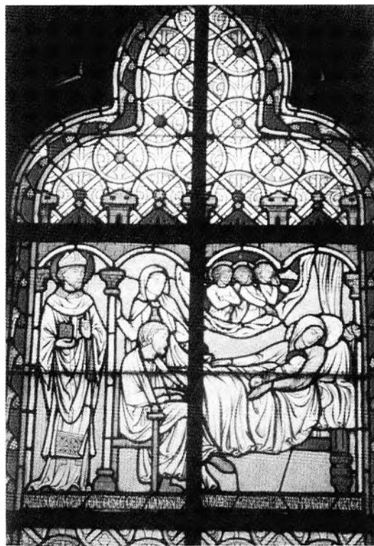
FIGURE 84. Digne, cathédrale, verrière de la Vie de saint Jérôme, Didron, 1855.