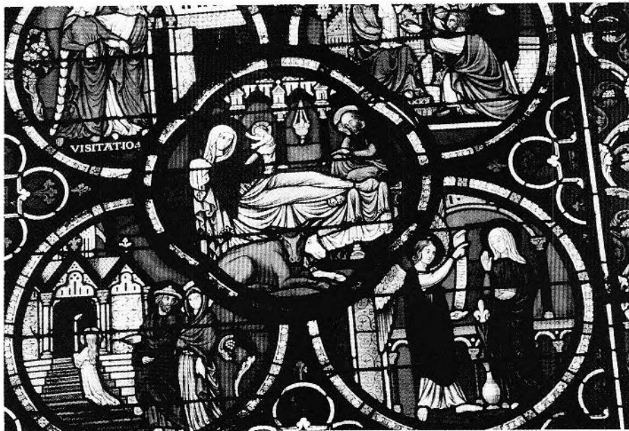
FIGURE 81. Le Mans, Notre-Dame de La Couture, verrière de la Vie de la Vierge, dessin Henri Géroente, 1844.