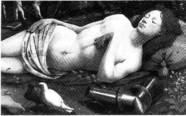
Figure 6 Piero di Cosimo, Vénus, Cupidon et Mars, vers 1486-1510, huile sur panneau, 72 x 182 cm, Gemäldegalerie, Berlin, détail

tre, de loin, les effets sensibles et pathétiques dans leurs modulations historiques et culturelles.