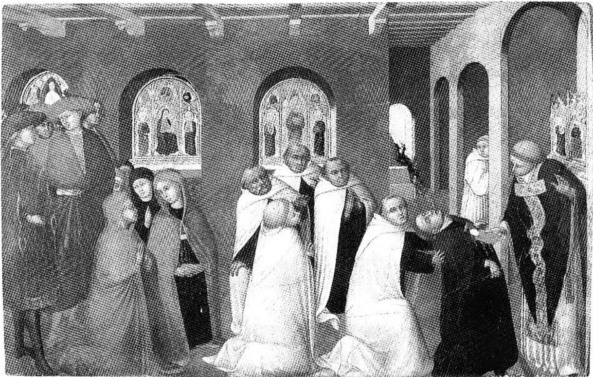
Figure 4. Stefano di Giovanni Sassetta, Le miracle du sacrement , vers 1430-32, tempera et or sur panneau, 24, 1 x 38, 2 cm, Durham, Barnard Castle, Bowes Museum.

Pourquoi cet intérêt de la part des historiens de l'art pour les insectes? Peut-être renferme-t-elle un élément de réponse dans la signification générale du terme imago . En plus de contenir le sens premier de représentation, de portrait, imago désigne dans le vocabulaire de la zoologie l'état définitif des insectes à métamorphoses. Le même terme, adopté par Freud, renvoie à une vision intérieure liée à la mémoire et à l'affectivité que l'on a d'un être ou d'une chose. Ce qui apparaît de manière plus évidente, c'est que chacun des moments théoriques pensés à travers un insecte renvoie au processus de figurabilité qui caractérise le travail du rêve, le travail de présentabilité des images propres aux formations de l'inconscient. Le concept de figurabilité permet de constater que toute image se présente comme représentant quelque chose 7 . En portant une attention particulière au problème de la relation entre l'œuvre d'art et le traitement du sujet, nous pouvons voir comment s'articulent les propositions des artistes et leur portée pour la peinture au plan pictural, c'est-à-dire