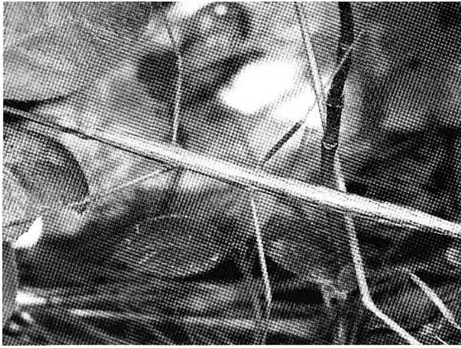
Figure 3. Phasme, photographie couleur (crédit photographique : Arcane 17 ; Image licenciée par Creative Commons Attribution ShareAlike 3.0 ; http://commons.wikimedia.org/wiki/Fil:Quel_insecte.JPG ).

ses directions critiques aux sciences humaines renouvelées. L'intérêt de son approche se situe en effet dans la manière privilégiée dont il explore les modalités et les procédures de ce qu'il appelle la présentation de la représentation. C'est au regard des spécificités des phénomènes artistiques et de l'importance de leur dimension plastique que Marin interroge l'image visuelle.