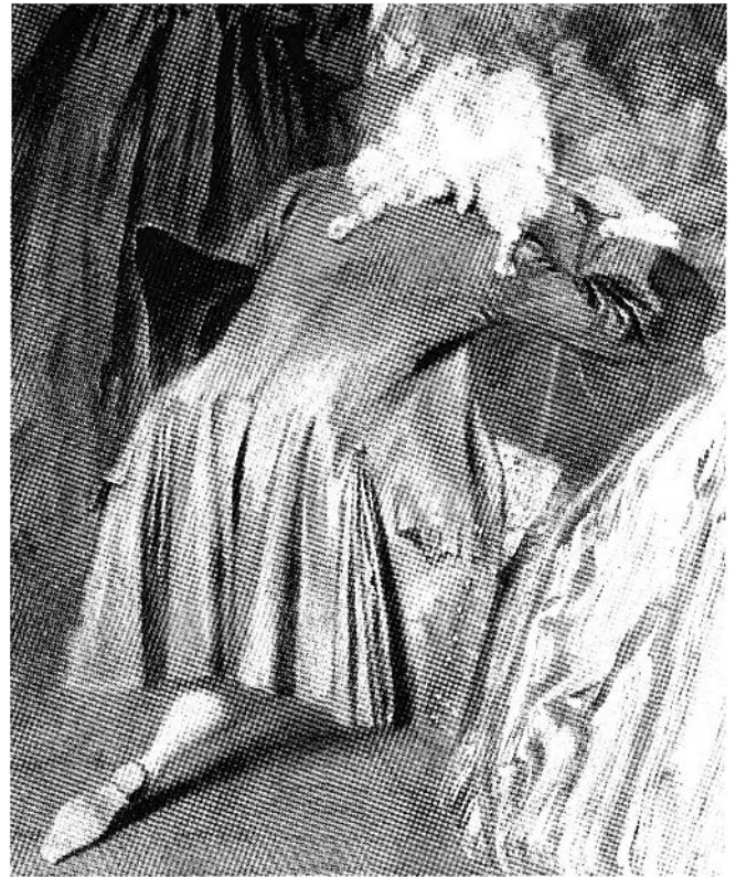
Figure 5. Antoine Watteau. L'enseigne de Gersaint , 1720, huile sur toile, 163 × 306 cm. Château de Charlottenburg, Berlin, détail

de la Renaissance, le trou béant que produisait le jaillissement du cri, cette tache refusée à la peinture, est devenue une litanie de formes toujours en transformation. Répondant à l'impératif de figurabilité, les insectes viennent incarner en peinture une modalité transverbale du hurlement. Peut-être trouvons-nous là cette « archéologie du silence » que Michel Foucault appelait de tous ses vœux pour définir la folie et qui se donnerait à voir paradoxalement par un cri de la peinture.