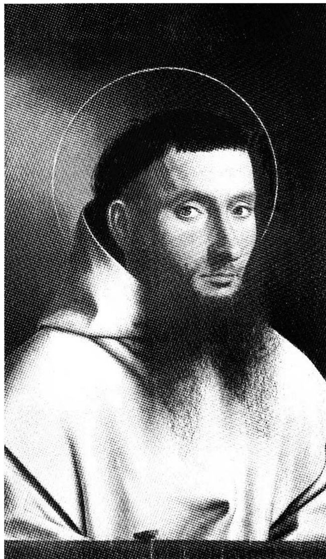
Figure 2. Petrus Christus, Portrait d'un moine chartreux , 1446, huile sur bois, 29,2 x 20,3 cm, Metropolitan Museum, New York (crédit photographique : Yorck Project, ©Zenodot Verlagsgesellschaft mbH ; mise sous licence GNU Free Documentation License ; http://commons.wikimedia.org/wiki/File:Petrus_Christus_007.jpg ).

Le jeu de l'insectarium et de la théorisation des pratiques de peinture se prolonge avec Louis Marin qui a tenté de faire l'expérience du regard de la fourmi en se glissant dans son corps pour éprouver la vision de l'insecte de Pascal. Cherchant à tra-