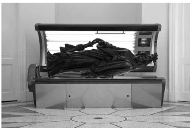
Figure 1. Allora & Calzadilla, Armed Freedom Lying on a Sunbed , 2011, sculpture et banc solaire, installation présentée au Pavillon des États-Unis lors de la 54 e Biennale de Venise, 165 x 256 x 134 cm.

en fait un des principaux symptômes de la « fin de l'art », cette nouvelle époque de l'art qui aurait connu ses premiers balbutiements avec la peinture de genre au XVII e siècle et aurait atteint son plein épanouissement avec les romans humoristiques de son contemporain... Jean Paul, justement. L'humour, comme fluidification des contraires, s'inscrira désormais au cœur du régime esthétique de l'art. D'entrée de jeu, il se chargera d'une dimension critique qui sera sans cesse actualisée par les artistes du régime esthétique de l'art, y compris les artistes d'avant-garde, au premier rang desquels les dadaïstes qui en feront grand usage au début du XX e siècle.