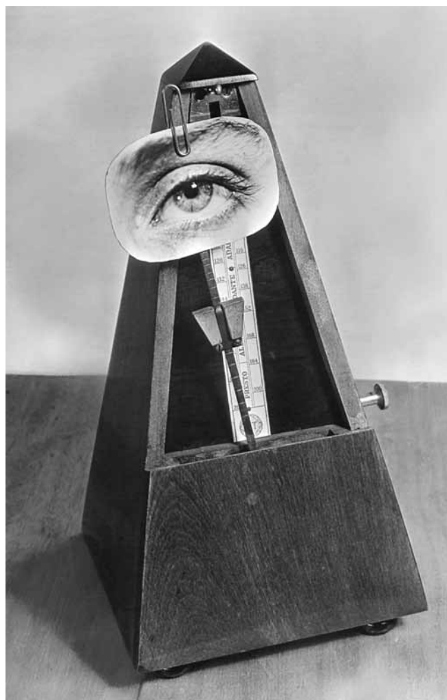
Figure 4. Man Ray, Objet indestructible , 1923, métronome et collage de photographie, 22,2 x 12 x 11 cm

C'est précisément ce principe de non-contradiction qui est remis en cause par l'humour romantique en permettant aux contraires de coexister dans un même ensemble. Cette cohabitation est rendue possible par une atténuation, presque un