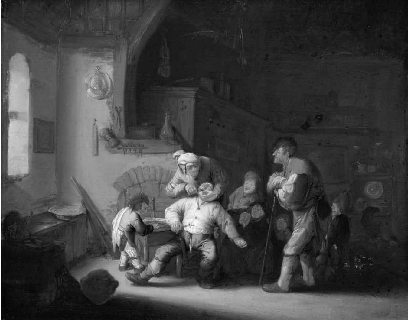
Figure 3. Adriaen van Ostade, Barbier de village arrachant une dent , vers 1637, huile sur panneau de chêne, 33,3 × 41,5 cm, coll. Kunsthistorisches Museum, Vienne.

du monde, de tous les domaines de la réalité, l'humour rétrograde vers le symbole, dans lequel la forme et la signification sont également étrangères l'une à l'autre » 43 .