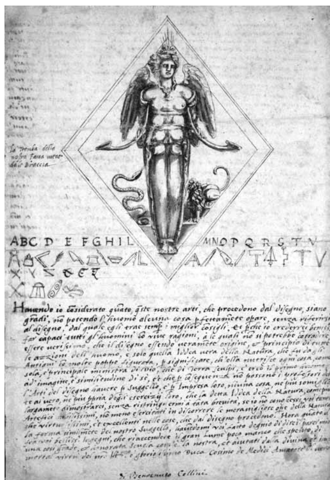
Figure 4. Benvenuto Cellini, Artémis d'Éphèse , projet pour le sceau de l'Accademia del Disegno, vers 1563, encre et aquarelle sur papier, 33 x 21,8 cm, Londres, British Museum.

Qui plus est, le texte fait de cette déesse nourricière la principale « ministra » de Dieu. Le mot « ministre » renvoie au rôle que peuvent jouer les sept planètes, dont font partie, dans la