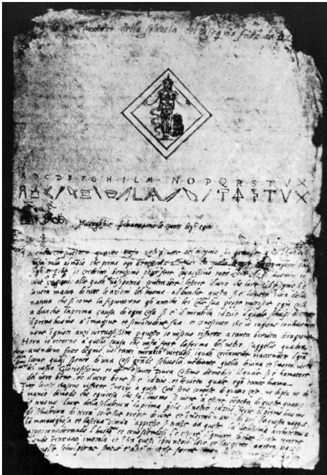
Figure 2. Benvenuto Cellini, Artémis d'Éphèse, projet pour le sceau de l'Accademia del Disegno, vers 1563, encre et aquarelle sur papier, 33,2 x 22 cm, Florence.

moment de la fonte du Persée aux côtés de ses ouvriers, en train de les aider et de les conduire tel un général en plein cœur de la bataille 30 .