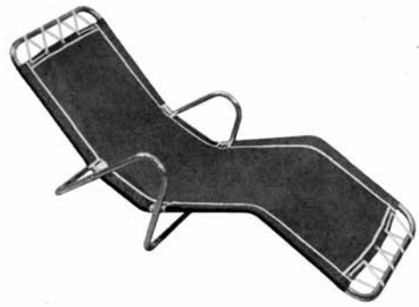
Figures 3 et 4. Chaise longue en aluminium dessinée par Julien Hébert et présentée à la Triennale de Milan en 1954. Il s'agit de l'un des premiers exemples de design canadien à être reconnu et diffusé dans les revues de design internationales.

cohérente avec les principes de fabrication modernes, une initiative qui allait mener à la fondation du Bauhaus en 1919. C'est le même type de constat d'urgence qui avait motivé les membres de l'Association des arts et industries de Chicago à se tourner vers le design pour promouvoir la création industrielle au sein de sa production dans les années 1930: 12 en effet, face à la piètre qualité des biens manufacturés dans la région, on avait fait appel à László Moholy-Nagy pour fonder le New Bauhaus à Chicago en 1937. Enfin, suite à la Deuxième Guerre mondiale, le Japan External Trade Organization (JETRO) avait été fondé au Japon pour stimuler le design pour des raisons semblables, alors que les produits japonais avaient une réputation de mauvaise qualité. 13 La pensée d'Hébert s'inscrit ainsi dans un contexte et une mouvance internationale qui cherche à favoriser l'essor du design sur le plan économique et pour stimuler une production cohérente, originale et de haut niveau.