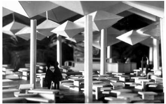
Figure 7. Photo de la maquette de la cafétéria du Pavillon du Canada à l'Expo 67, aménagement de Julien Hébert.

en 1962 et la Caisse de dépôt et placement en 1965. Ce sont ces institutions qui vont permettre le développement et l'esprit d'entrepreneuriat dans les années 1970. Malgré ce contexte, le manque d'intérêt pour la promotion du design exprimé par le gouvernement Lesage dans les années 1960 ne fait que contribuer à retarder l'évolution du Québec en ce qui a trait à l'émergence du domaine du design au sein de l'industrie de transformation secondaire.