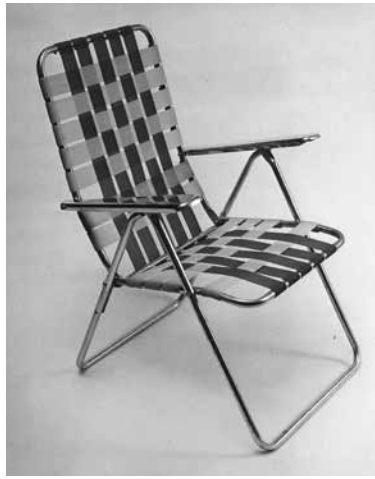
Figure 1 (gauche). Fauteuil conçu par Julien Hébert et soumis au premier concours de design au Canada en 1951.