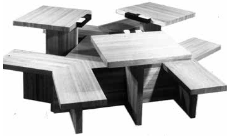
Figure 6. Mobilier pour la cafétéria du Pavillon du Canada à l'Expo 67, design de Julien Hébert.