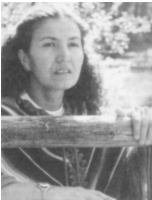
Jeannette Armstrong, auteure des romans Slash et Whispering in Shadows . Membre du conseil de la bande Penticton des Okanagans (Colombie-Britannique), elle dirige depuis 1989 l'École internationale d'écriture En'Owkin, qui dépend de l'Université de Victoria.