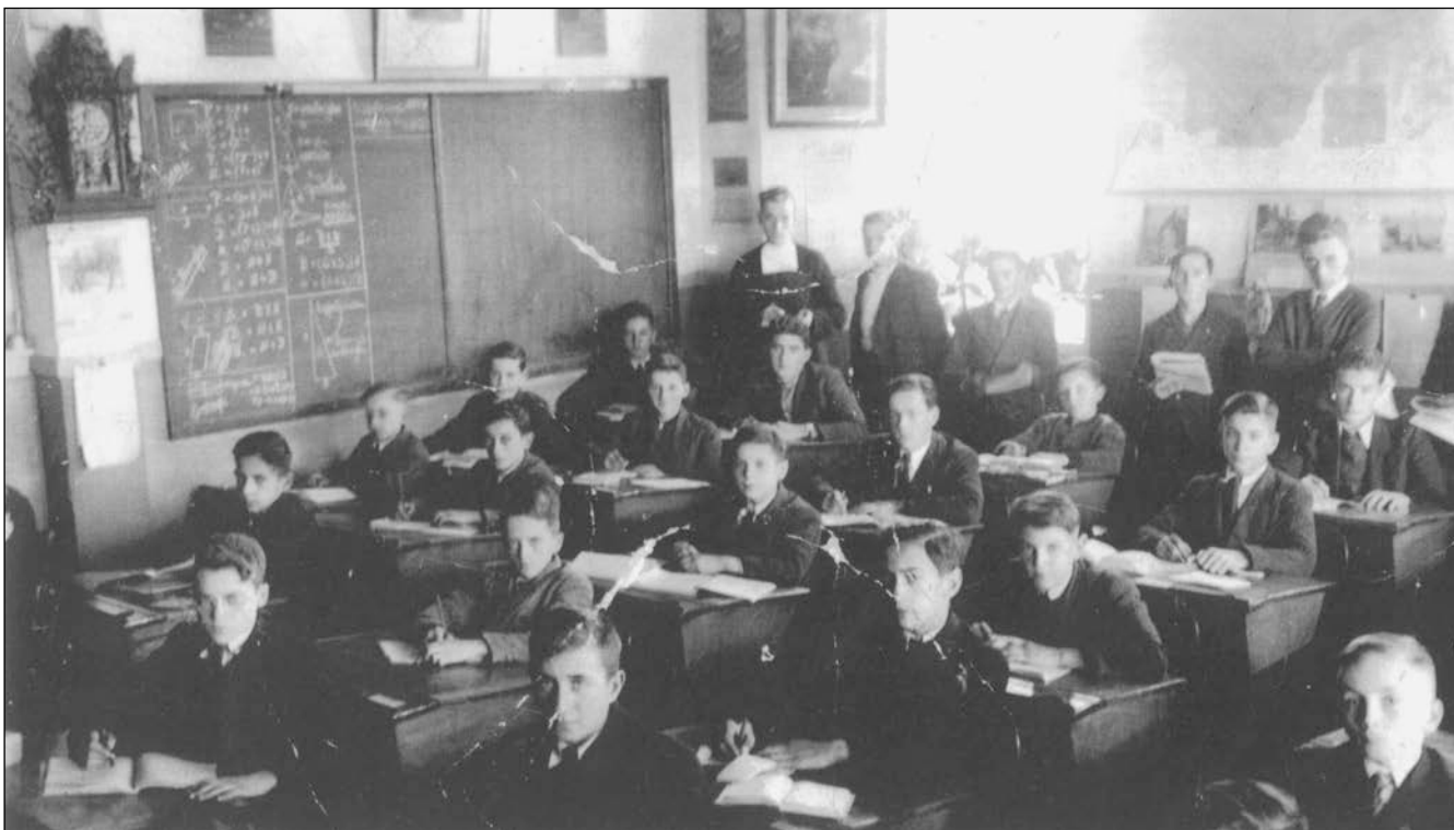
Plusieurs lecteurs reconnaîtront ce type de photo de classe, populaire dans les années 1950. Celle-ci illustre parfaitement la stratégie gouvernementale visant à intégrer les élèves amérindiens aux élèves blancs