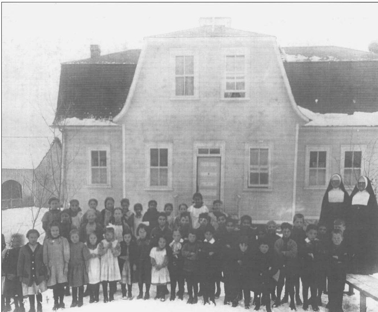
École primaire au village huron, près de Québec, dans les années 1950. La métamorphose des enfants amérindiens s'opérait sous l'œil vigilant des institutions religieuses (Archives du Conseil de la nation huronne-wendat, Wendake, Québec)

de son fameux Livre rouge intitulé Citizens Plus , suivant la représentation avancée par le Rapport Hawthorn. On y déclare :