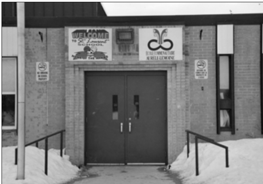
Entrée de l'école Saint-Laurent montrant la division entre les écoles anglophone et métisse

finalement insatisfaisant. Comme le raconte ce répondant qui avait quitté la communauté pendant quelques années :