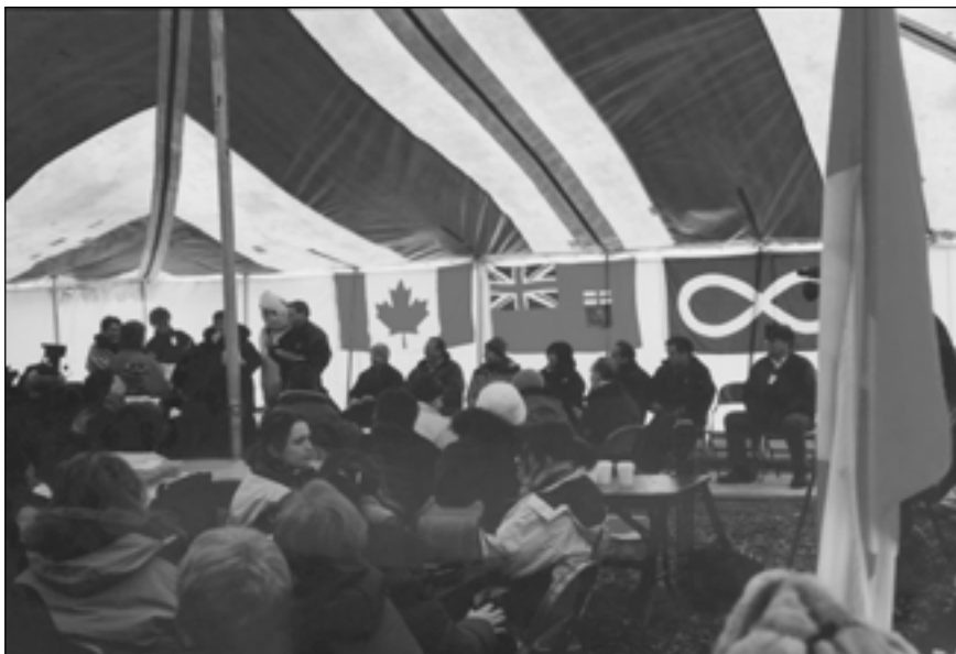
Cérémonie du festival Manipogo avec les drapeaux canadien, manitobain et métis à l'arrière-scène

Pour un sociologue, la problématique de sous-scolarisation, qui prévaut dans ces communautés à tradition orale minorisée, n'est pas uniquement une question d'apprentissage scolaire mais relève également de l'acculturation. Les jeunes de ces communautés souffrent non seulement d'un problème personnel de scolarisation mais sont aussi entraînés dans une spirale collective de perte de culture. En somme, la scolarisation, si elle permet de résoudre certains problèmes, ne résout pas nécessairement tous les problèmes d'intégration de l'individu. D'ailleurs, il apparaît que l'écrit ou la scolarisation pour les jeunes de ces communautés n'a souvent qu'un usage opérationnel, c'est-à-dire obtenir un emploi (Lafontant et Martin 2000), et ne sert pas de lien avec la culture et les générations passées, comme le faisait la littérature orale ou comme l'écrit le permet dans les sociétés à tradition écrite. Au contraire, l'écrit et l'éducation scolaire creusent le fossé culturel en ouvrant sur un tout autre univers, celui de la culture de la majorité, et ne répondent donc que partiellement au double problème des jeunes de ces communautés.