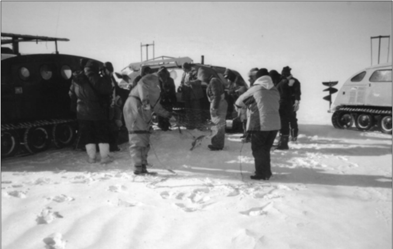
Démonstration de pêcheurs lors du festival Manipogo

développement socio-économique des collectivités francophones, ont permis à la communauté de développer plusieurs projets culturels, dont plusieurs festivals. Récemment, une délégation d'hommes d'affaires français a été invitée à Saint-Laurent par le CDEM pour tenter d'établir des liens économiques et touristiques entre le Manitoba francophone et la France.