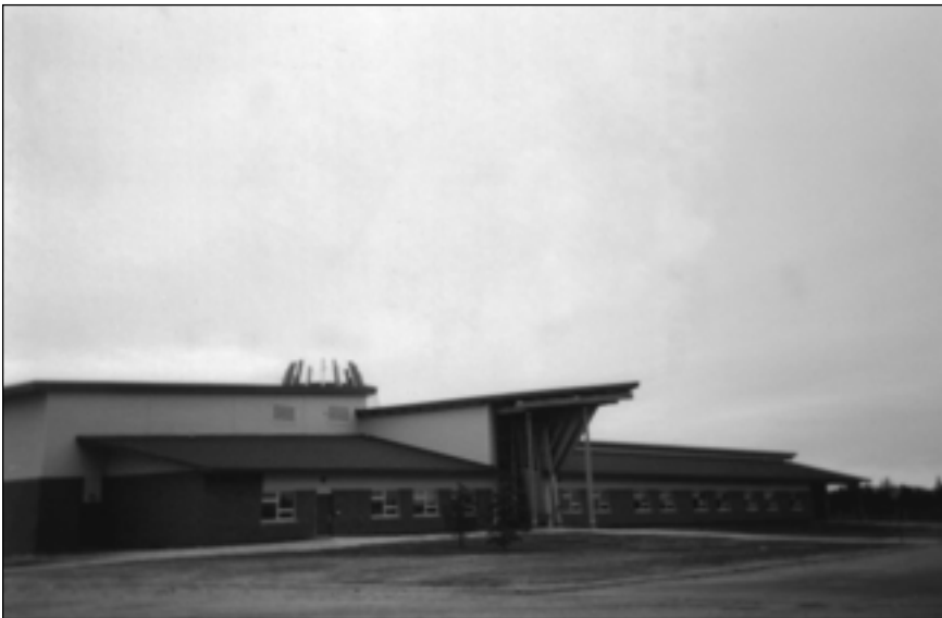
Photo 13 « L'école de mon p'tit frère. Il aime ça y aller. » (Éric Jean-Pierre, 16 ans, Uashat, 2003)

nature (photo 7), les adultes significatifs de la communauté et de l'extérieur (photo 8), les jeux (photo 9), les fiertés (photos 10-11), les institutions respectées et les événements appréciés (photos 12-13).