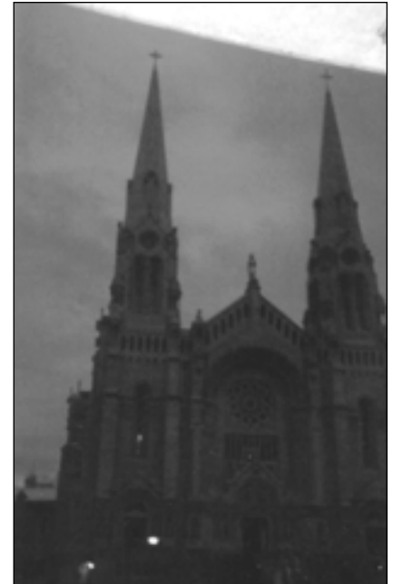
Photo 10 « La photo que j'ai eu beaucoup de difficulté à prendre et qui me tient à cœur. » (Myriam Vollant, 14 ans, Uashat, 2003)