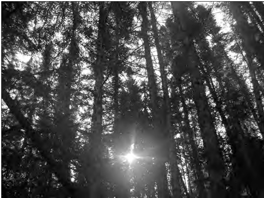
Exemple d'une forêt ancienne

L'île fait l'objet d'un intense combat juridique entre les Innus de Betsiamites, qui voudraient voir son intégrité écologique protégée intégralement, et la compagnie Kruger et le gouvernement du Québec, qui proposent plutôt d'exploiter la richesse forestière de 78 % de sa superficie et ce, sur un horizon d'une quarantaine d'années. Le bois du territoire en question fut alloué à Kruger en 1997 via un contrat d'approvisionnement et d'aménagement forestier (CAAF), et Kruger l'exploite depuis