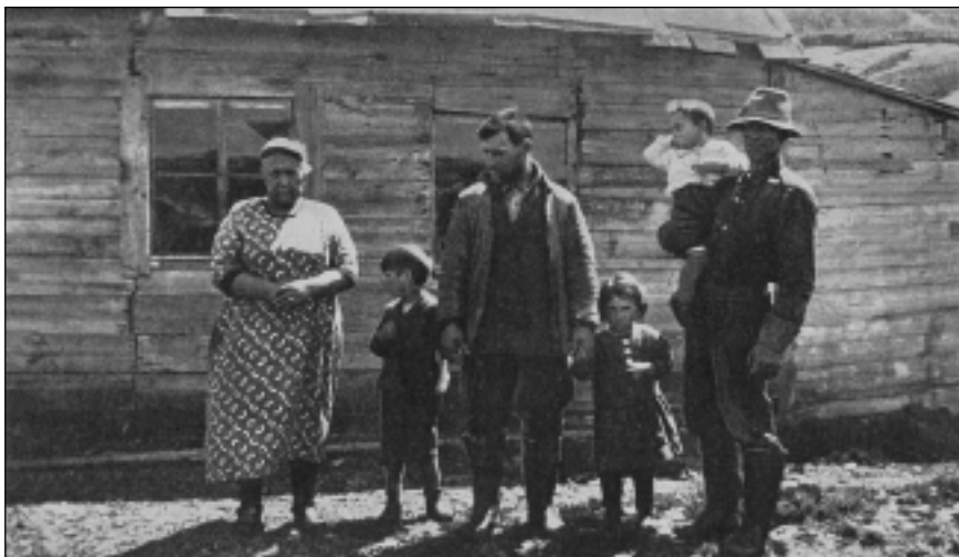
Une famille métisse euro-inuite de l'archipel de Saint-Augustin vers 1935

Du côté de l'actuelle Basse-Côte-Nord, les mentions de la présence de descendants d'Inuits au XX e siècle sont plus rares, mais on en trouve quand même chez quelques auteurs