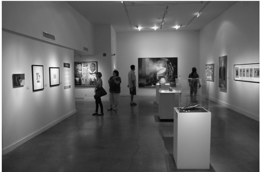
Exposition Fifty Years/Fifty Artists , Museum of Contemporary Indian Arts, Santa Fe (Photo de Nicolas Rostkowski, août 2012)

Le Musée de l'IAIA a aussi fait œuvre d'éditeur pour marquer son anniversaire. Intitulé New Native Art Criticism MANIFESTATIONS (en majuscules), l'ouvrage est consacré exclusivement à des artistes vivants et met en évidence l'importance du développement d'une interprétation de l'art amérindien par des critiques et des historiens de l'art autochtones (Mithlo 2012). Les auteurs font valoir que les discours sur l'authenticité ou la modernité de l'art amérindien sont demeurés majoritairement entre les mains des anthropologues, des historiens de l'art et des collectionneurs non indiens et ils proposent d'établir un dialogue multiculturel. Dans l'avant-propos, la directrice du musée, Patsy