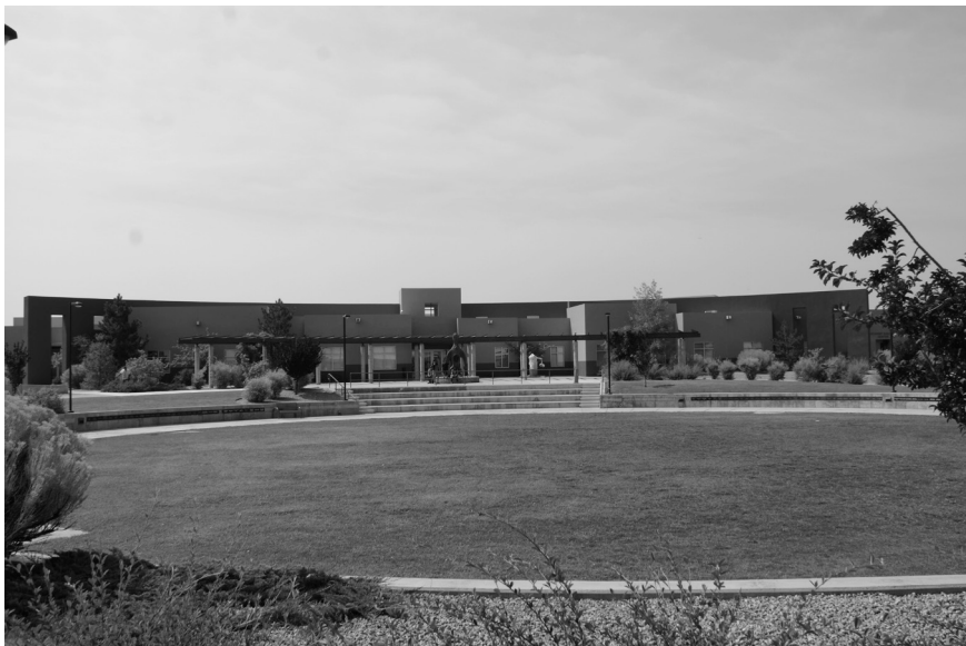
Campus de l'Institute of American Indian Arts : le cercle de vie, place centrale

À la fin de l'année 1965, l'IAIA monta sa première exposition nationale organisée dans un espace privé : le Riverside Museum de New York, mais toujours avec la coopération du ministère de l'Intérieur, du Commissaire aux affaires indiennes, Philleo Nash, et de l'Indian Arts and Crafts Board. Intitulée Young American Indian Artists , cette exposition de peinture et de sculpture était caractérisée par l'abstraction. Les critiques de l'époque se plaisaient à souligner les affinités spontanées entre art primitif et modernisme. Les journalistes qui découvraient les œuvres des jeunes artistes de l'IAIA faisaient remarquer que la stylisation et le symbolisme faisaient partie intégrante des modes d'expression artistiques traditionnels.