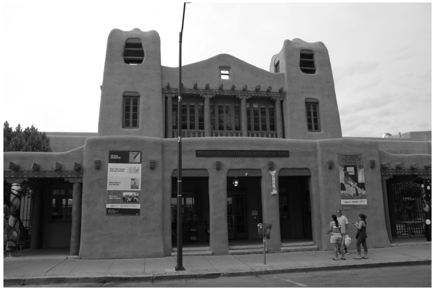
Museum of Contemporary Native Arts (MoCNA), place de la Cathédrale, Santa Fe

La spécificité de l'Institute of American Indian Arts (IAIA), mis en place trente ans plus tard, tenait à son approche plus novatrice. Au seuil des années 1960, décennie marquée par la contre-culture, la lutte pour les