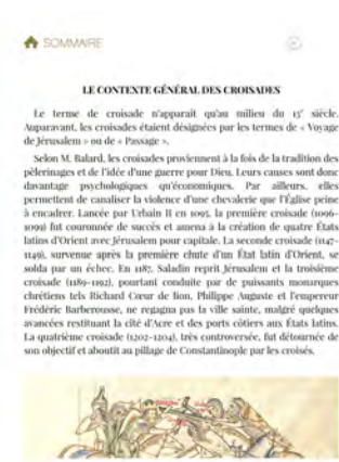
Illustration 4 : Parcours « Explorer, premiers repères » (extrait de l'édition enrichie)

Ce parcours ouvre déjà des pistes vers le troisième volet de l'édition, par exemple à travers un abécédaire interactif.