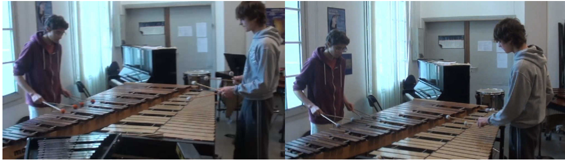
Extrait vidéo 9 : Jazz-Afro 12/8.