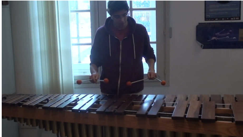
Extrait vidéo 3 : Travail du répertoire « Rotation 1, d'Eric Sammut ».

Cet exemple illustre l'utilisation du logiciel pour travailler une pièce solo du répertoire de percussions basée sur une analyse harmonique de l'œuvre. Ici, l'élève a analysé un passage de la pièce, puis a transcrit la grille d'accord dans le logiciel en vue de répéter ce même passage et d'inspirer son travail d'interprétation. Ce travail lui permet également d'analyser et de répéter son répertoire de manière plus créative.