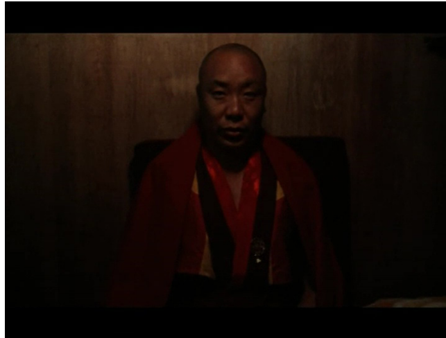
Extrait vidéo 2 : Johan van der Keuken, Vacances prolongées (2000), Continuum des ablutions à la récitation d'un moine bouddhiste, 21:30-22:45