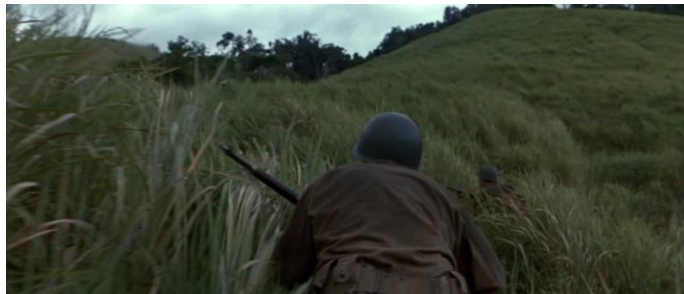
Extrait vidéo 4 : Terrence Malick, La Ligne rouge , scène où deux soldats partent faire un repérage dans les collines (00:44:36-00:45:17) © Twentieth Century Fox Film Corporation.

Le film La Ligne rouge , marqué par l'esthétique contemplative de Malick, comporte naturellement l'une des premières manifestations de cette utilisation de la quinte dans la séquence où deux soldats se font tuer alors qu'ils partent faire un repérage dans les collines gardées par les japonais. Ils sont comme paralysés par la crainte du sort funeste que leur réserve leur progression vers le camp adverse. Ils sont figés dans l'instant suspendu d'une ellipse temporelle connotée à la fois par le changement de la lumière sur les herbes hautes de la colline balayée par le vent, ainsi que par la quinte à vide ( ré-la ) étendue à tous les registres de l'orchestre (résonant plus ostensiblement à la harpe). Selon Michel Fleury, les quintes superposées suscitent un statisme que différents compositeurs associent à l'idée de solitude, de calme immuable de la nature ou encore d'évocation de la torpeur moite de la jungle profonde (Fleury 1996, p. 220). Trois qualificatifs qui correspondent au ressenti des soldats dans le film et à l'atmosphère générale de l'intrigue (extrait vidéo 4).