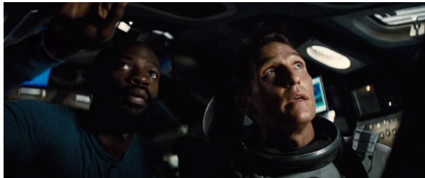
Extrait vidéo 8 : Christopher Nolan, Interstellar, scène où le vaisseau piloté par Cooper s'apprête à pénétrer dans un trou de ver (00 :56 :33-00 :58 :09)