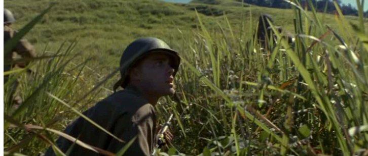
Extrait vidéo 7 : Terrence Malick, La Ligne rouge , progression des soldats américains vers le camp ennemi dans les explosions (00 :45 :20-00 :47 :53)

Bach dans son ouvrage Éthiques du temps (Franco-Rogelio 2014, p. 130), dans les deux films, cette scansion récurrente de ce cluster diatonique « entraîne » tous les autres motifs – ceux au lyrisme dissonant partien associé au mysticisme sombre de Silas ou encore les cellules de l’orgue reliant ailleurs Cooper à sa famille – vers lui « à la manière d’un trou noir ».