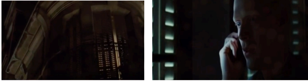
Figures 3a et 3b : Ron Howard, Da Vinci Code, deux photogrammes de la scène où Silas est assimilé à un vampire (06:19-07:15)

Extrait audio 6 : Hans Zimmer, Da Vinci Code, cue « The Paschal Spiral » (00: 00-00:54) © Decca. Écouter.