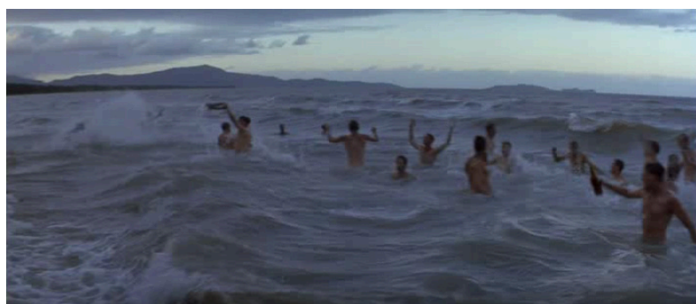
Extrait vidéo 1 : Terrence Malick, La Ligne rouge , recueillement sombre des soldats pendant une période de relâche (02 :00 :43- 02 :03 :23) © Twentieth Century Fox Film Corporation.

dans un contexte plus postromantique au moment où le Docteur Lecter soigne l'agent Starling, dont il est épris, pour accompagner cette brève trêve du monstre. Mais c'est surtout dans le cue de Da Vinci code intitulé « Malleus Maleficarum » (marteau des sorcières) au caractère contemplatif, mystique et douloureux que cet hommage au Cantus réapparaît ostensiblement pour souligner un des flashbacks les plus importants du film, dans lequel le secret sur la descendance du Christ nous est révélé par des images évocatrices de peintures préraphaélites (extrait audio 2 et figures 1a, 1b et 1c). Que ce soit dans « Light » ou « Malleus Maleficarum », une même ligne mélodique à la mélancolie recueillie chute inlassablement, donnant une impression similaire de géotropisme statique fait essentiellement de valeurs longues. Le tout converge sur une gamme modale et non modulante – do mineur modal dans La Ligne Rouge , la mineur modal dans Da Vinci Code – renvoyant à la même sacralisation de l'accord parfait 5 (exemples 1a et 1b).