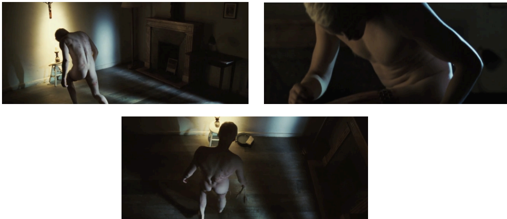
Figures 2a, 2b et 2c : Ron Howard, Da Vinci Code , trois photogrammes de la scène où Silas s'inflige des sévices corporels (07:16-08:50) © Columbia Pictures.

Pour « Paschal Spiral », comme le fait Arvo Pärt dans le début de Trisagion , Zimmer maintient une note pédale dans le grave sous une texture éthérée. Enfin, au moment précis où Silas prononce les mots « Je châtie mon corps », devant la croix du Christ fixée au mur de sa chambre ascétique, il reprend la même structure que la fin de Festina Lente . La répétition pianissimo d'un intervalle tendu à la texture fantomatique est suivie d'un silence, d'un « presque rien » (Jankélévitch 1976, p. 21) chez Zimmer, puis d'un éclat douloureux des cordes (exemples 3a et 3b). Pour correspondre au programme esthétique du film qui consiste à conjuguer des éléments du passé avec un savoir faire moderne à l'aide de l'électronique et du numérique, comme ailleurs dans certaines œuvres du compositeur estonien ( Cantus in memoriam Benjamin Britten , Trisagion ), lequel a étudié la monodie grégorienne, Zimmer mêle ici une écriture contemporaine, mâtinée de drones et autres infrabasses, avec des hommages à la musique ancienne. Il traite un des thèmes principaux du film relié à la quête du Saint Graal – très évocateur d'un plain-chant joué à l'alto ici – à la manière d'un organum, les notes contre notes formant souvent des intervalles de quintes et de quarts (exemple 4).