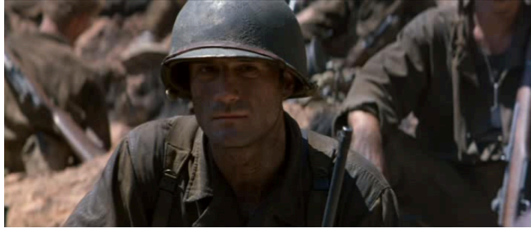
Extrait vidéo 2 : Terrence Malick, La Ligne rouge , séquence de l'assaut du camp japonais par les soldats américains (01 :39 :36- 01 :50 :18) © Twentieth Century Fox Film Corporation.