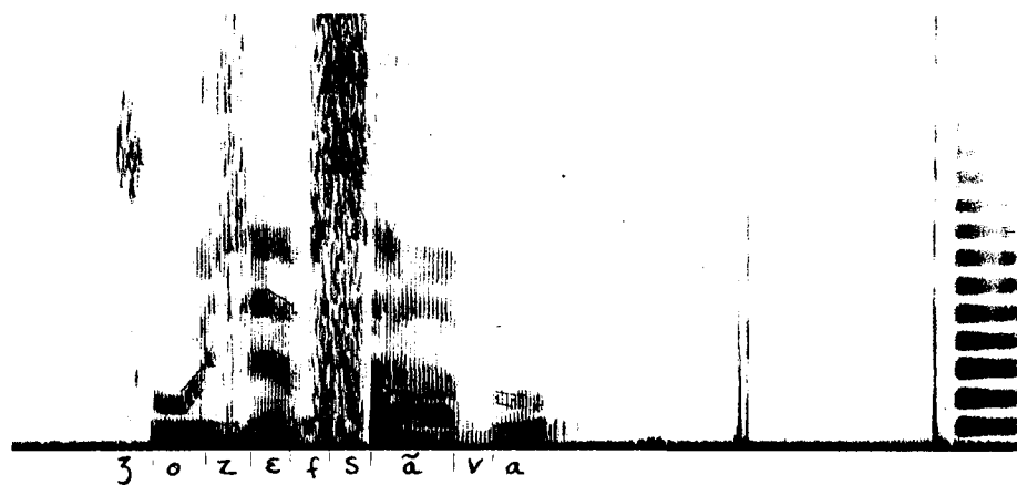
Figure 2: Sonogramme de l'énoncé: Joseph s'en va