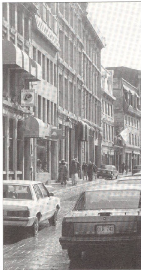
La valeur d'un quartier historique mérite d'être signalée et interprétée.