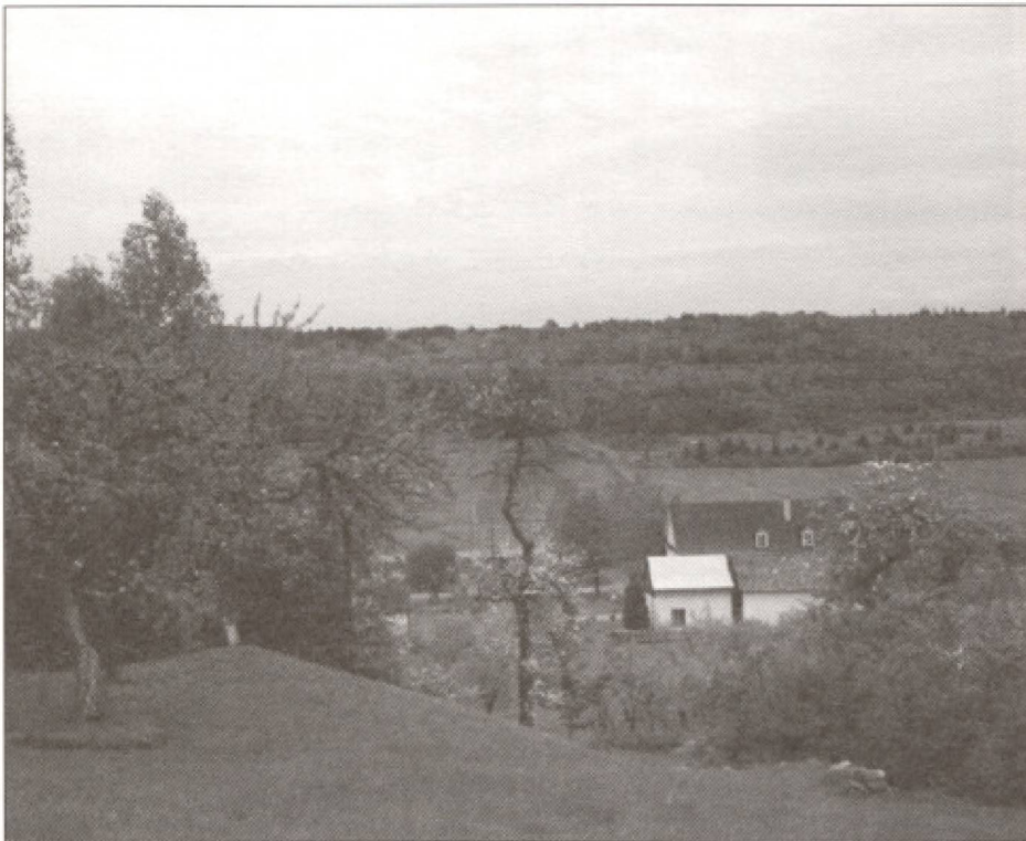
Les vergers et la Maison de la prune, écomusée de la prune, Saint-André de Kamouraska.

ment alors que la plupart enregistre précisément le nombre de visiteurs. Avec la venue des treize nouveaux projets (sélections de mai et octobre 1996), l'intérêt d'identifier les types de visiteurs, leur profil, leurs besoins se fera davantage sentir. Dans certains cas, les études de marché viseront aussi à prévoir la réponse des clientèles en fonction d'un projet particulier.