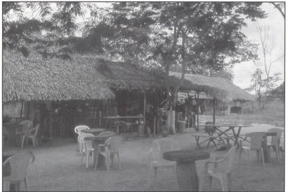
En Amérique latine, ce camp d'entraînement de guerrilleros s'est déguisé en site d'extraction de l'or : touristes locaux et internationaux y affluent depuis, pour le plus grand bénéfice de... Un autre exemple des défis que peut imposer le tourisme aux communautés d'accueil

secteur concurrentiel criant à la concurrence déloyale ;