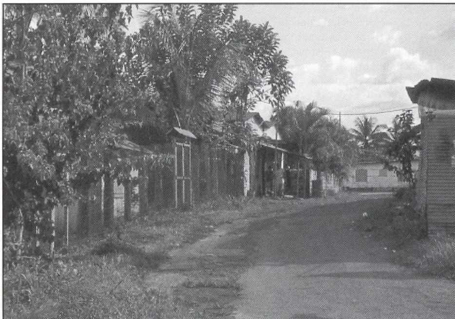
Las Claritas, aux portes de la Savane vénézuélienne et en attente d'un tourisme qui apporte quelque retombée à la communauté d'accueil

En Amérique latine, le développement du tourisme social s'est réalisé sous diverses formes, que ce soit avec l'appui de l'État, d'institutions privées ou de syndicats. Au Mexique, par exemple, la direction du tourisme social au Secrétariat du tourisme (SECTUR) a mis de l'avant des programmes visant à promouvoir des vacances à des prix accessibles. C'est aussi cette même instance du gouvernement fédéral qui anime le Conseil national du tourisme social créé pour faciliter la coordination des actions mises de l'avant par les principaux acteurs du tourisme pour tous au Mexique. Parmi ceux-ci, se trouve l'Institut mexicain de sécurité sociale (IMSS) qui possède quatre grands centres de vacances où les familles et les jeunes peuvent bénéficier de séjours de vacances à de très bons tarifs. Il y a également le Congrès du travail et l'organisme public TURISSSTE qui offrent respectivement aux travailleurs syndiqués et aux employés du gouvernement fédéral des forfaits à des prix infé-