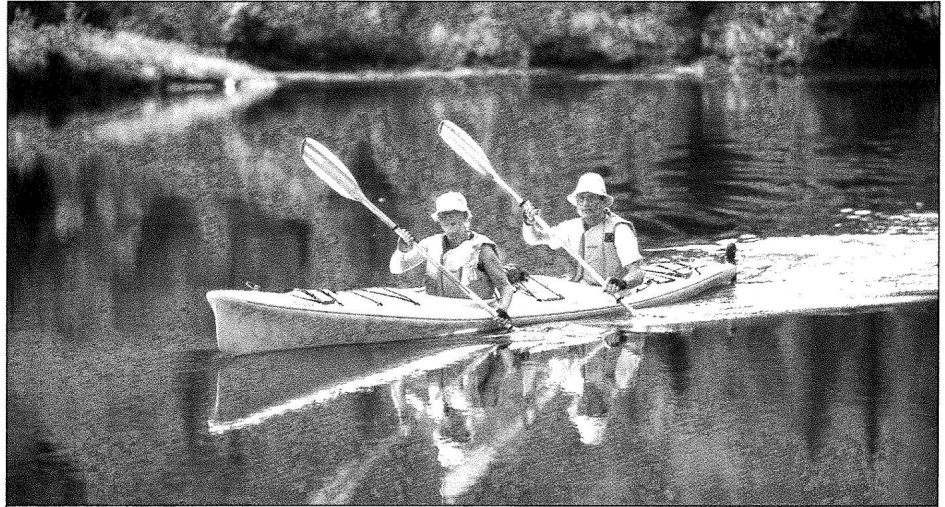
Parc national de la Jacques-Cartier (Québec).