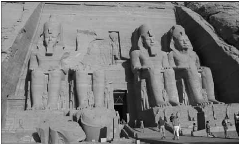
Le site d'Abou Simbel (Égypte).