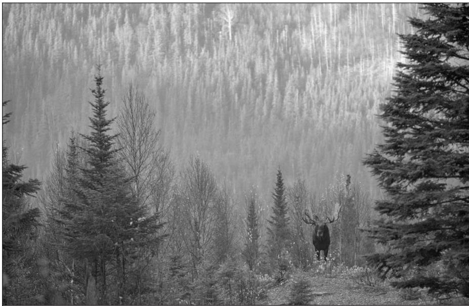
Original dans le paysage forestier du Parc national de la Gaspésie (Québec).

Dans un premier article, G. Beudet analyse comment les rapports entre l'Homme et la forêt n'ont cessé d'évoluer et de se transformer et ce, depuis le Moyen Âge.