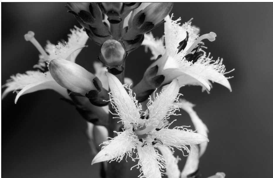
Trèfle d'eau sur l'Île-d'Anticosti, région touristique de Duplessis (Québec).