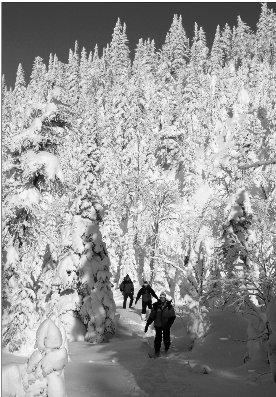
Raquette au parc national des Monts-Valin (Québec).

Comme la conservation et la mise en valeur des paysages, des ressources naturelles et des richesses culturelles peuvent être qualifiées d'essentielles au sein de l'offre touristique en forêt, le Québec se doit de mettre en œuvre les moyens nécessaires pour implanter le tourisme de nature durable sur son territoire. Pour ce faire, nous proposons un cadre d'évaluation adapté aux réalités des forêts publiques québécoises, où les industries forestière et touristique se partagent un même territoire et visent à évaluer le niveau de durabilité des organisations touristiques au regard de leur gestion environnementale, sociale et économique. Ce modèle, jusqu'à aujourd'hui inexistant au Québec, est issu des résultats du travail de maîtrise de Véronique Desmarais, sous la direction de Louis Bélanger. Il se veut une contribution aux efforts d'encadrement du tourisme de nature durable initiés par