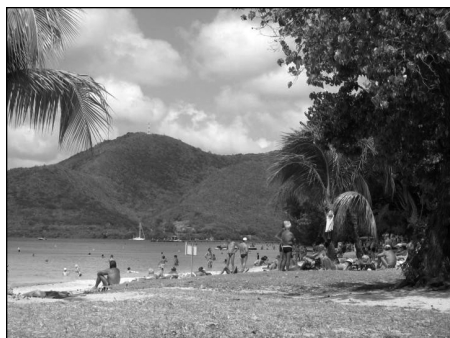
Touristes à Sainte Lucie.

Leakages are particularly high in small developing country island economies, for many of which tourism is the principal export earner—examples are: St. Lucia 45% [...], average for the Caribbean region is reported to be around 70% [...] while a tourism official of the Bahamas states that in 1994 leakages for that country might have been as high as 90% (Meyer, 2006 : 7).